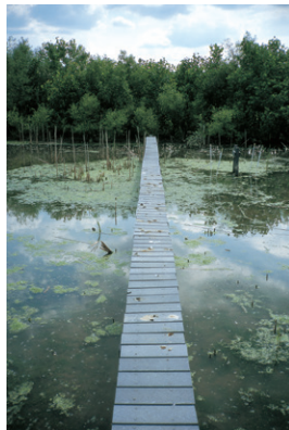
(Untitled 2001-June) オハイオ州立大学キャンパス(コロバス/USA)