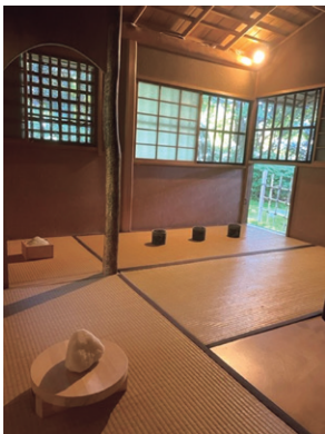
(Untitled 2022-September) 色金山歴史公園茶室(長久手)