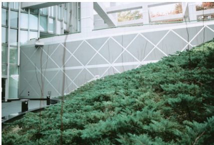
(Untitled 1976-'88) 都市空間と木の造形展、名古屋市美術館サンクンガーデン(名古屋)